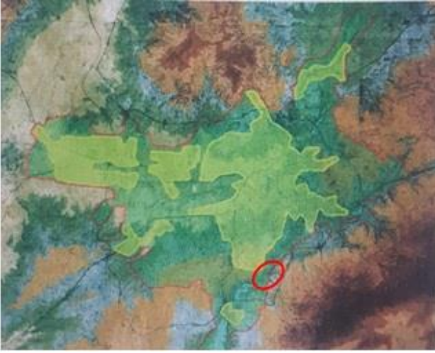
Şekil 2: Ankara 1990 Planı'nda yer alan yeşil kuşak ve İmrahor Vadisi'nin konumu (Günay 2006)

Ankara 1990 Nazım Planı'nın vadileri kentsel açık yeşil alan olarak değerlendirme yaklaşımı, kentte bir yeşil kuşak oluşturma süreci olarak düşünülmektedir. Planda İmrahor Vadisi, Dikmen Vadisi gibi vadilerde yerleşimin önlenmesi ve bu alanların hava koridorları olarak değerlendirilmesi ile ilgili kararlar, kentin 1970'lerden beri sıkıntısını çektiği hava kirliliğine çözüm olmuştur. Ayrıca planda vadiler kentliler için rekreasyon ve dinlenme alanları olarak da düşünülmüştür (Kayasü 2006; NİP 2007; Güleç Özer ve Başkurt 2017). Planın uygulanma aşamasında çeşitli etaplarda ağaçlandırma çalışmaları yapılmıştır, fakat zamanla planlanan bu yeşil kuşağın hayata geçmesini engelleyen alt ölçekli plan kararları üretilmiştir (NİP 2007).