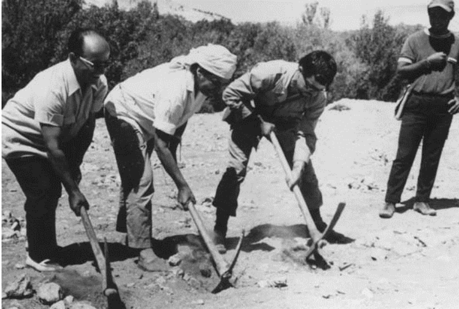
Keban Barajı'nda ilk kazı